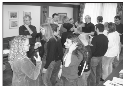
Deltagare skapar närkontakt