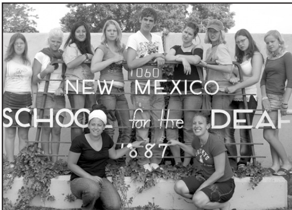
Språkintresserade ungdomar i New Mexico