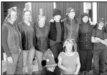
Hästintresserade deltagare i Långbens tema

Bland annat gjordes det en utflykt till Visby där de fick se sig omkring och shoppa lite.