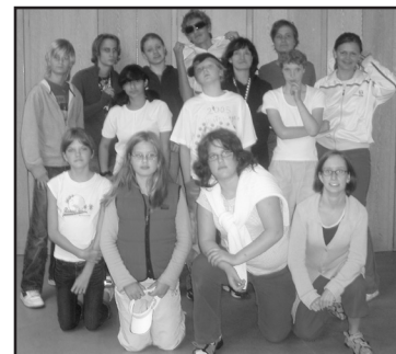
Kulturella deltagare på Teaterläger

De hade en temafest en kväll och det var en fest med rollbyten genom att tjejer och killar bytte kläder med varandra där det fanns snacks och dricka. Det blev också många lekar som uppskattades av deltagarna. Sista dagen fick deltagarna bland annat göra en uppvisning för sina stolta föräldrar.