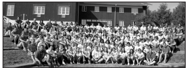
Internationella ungdomar i Leksand

På lägret deltog döva från hela världen, ungdomar i åldern 13-17 år (79 ungdomar), unga personer 18 - 30 år (25 gruppleddare), WFDY:s styrelse (sju ledamöter), svenska stödledare (fem st), SDU:s styrelse (fyra ledamöter), mediagruppen (fyra st) och svenska organisationskommittén (tre st). Totalt var det 127 deltagare från 26 länder. Vi hade många nya länder som inte deltagit i världsjuniorlägret förut som t.ex. Gambia, Kanada, Laos, Lettland, Nepal, Nicaragua, Nya Zeeland, Ryssland, Slovenien, Slovakien, Sri Lanka, Thailand och Tyskland.