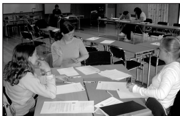
Kursdeltagare på personalutbildningen planerar inför lägret.